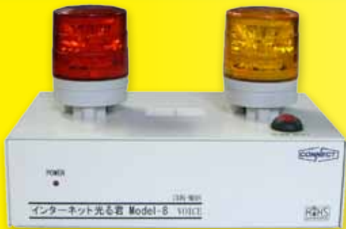
インターネット光る君 Model-8

SNMP Trap 受信 SNMP Trap 送信 Syslog 送信 Ping 監視 18 警報音 / 警報音声 独自アラーム設定 SNMP Get/Set 制御 RSH/Lanbo コマンド制御 4 接点入力 4/8 接点出力 NTP クライアント Web GUI 設定