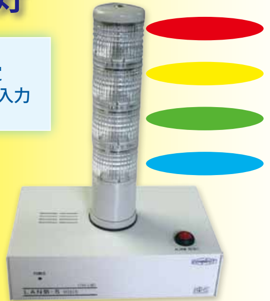
LAN 防 -5